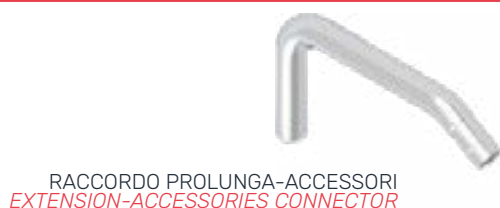
RACCORDO PROLUNGA-ACCESSORI EXTENSION-ACCESSORIES CONNECTOR