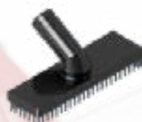
SPAZZOLA RETTANGOLARE 300mm 300mm RECTANGULAR SHAPED BRUSH