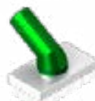
SPAZZOLA RETTANGOLARE RECTANGULAR SHAPED BRUSH