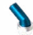
SPAZZOLA ROTONDA ROUND BRUSH