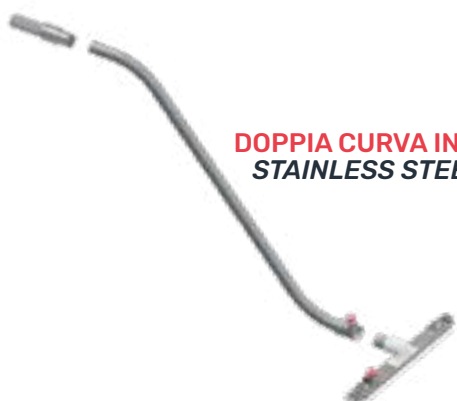
DOPPIA CURVA INOX STAINLESS STEEL DOUBLE BEND